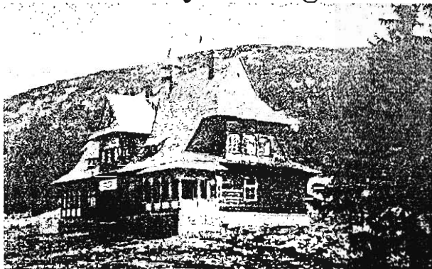
Schronisko P. T. T. na Piłsku

Dawne schronisko PTT na Hali Miziowej pod Piłskiem. Zbudowane zostało w r. 1930 przez Oddz Babiogórski w Żywcu. Uchodziło ono za najpiękniejsze w polskich górach. Spłonęło niestety w r. 1953.