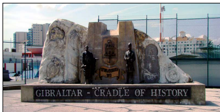
Gibraltar - terytorium zamorskie Wielkiej Brytanii