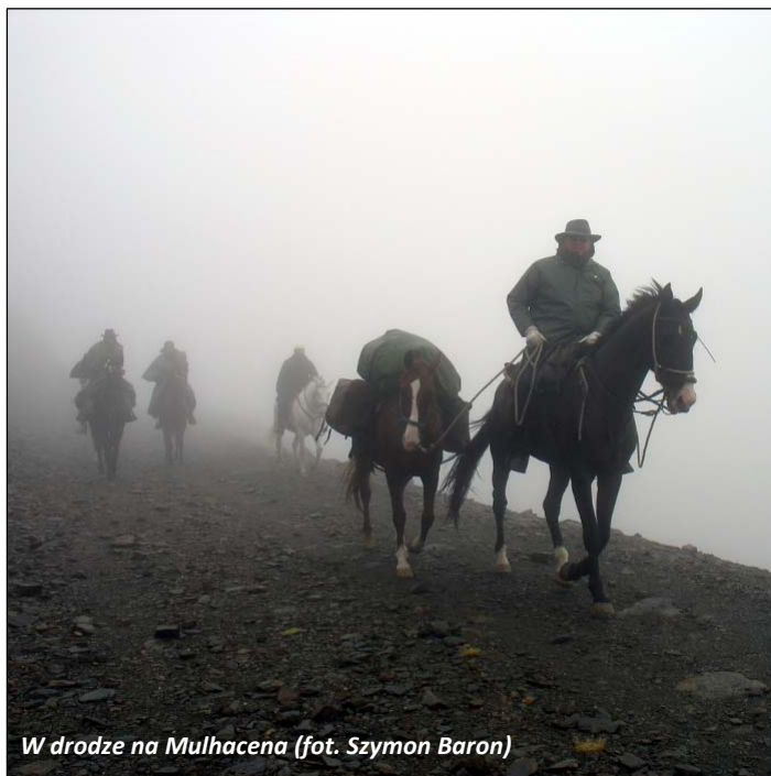
W drodze na Mulhacena

Europy - Przylądek Marroquí oraz połączoną z nim mostem Isla de Las Palomas. Drugą część dnia spędziliśmy z kolei w położonym 40 kilometrów dalej Gibraltarze – brytyjskim terytorium zamorskim graniczącym z Hiszpanią. Poruszaliśmy się pieszo mając wrażenie, że przebywamy gdzieś w Anglii... Jedynym niepasującym do Wysp Brytyjskich faktem był prawostronny ruch samochodów. Kolejną wyjechaliśmy na Skale Gibraltarską (426 m n.p.m.), by podziwiać rozległą panoramę na afrykańskie wybrzeże położone po drugiej stronie Cieśniny Gibraltarskiej. Atrakcją tej góry zwanej też