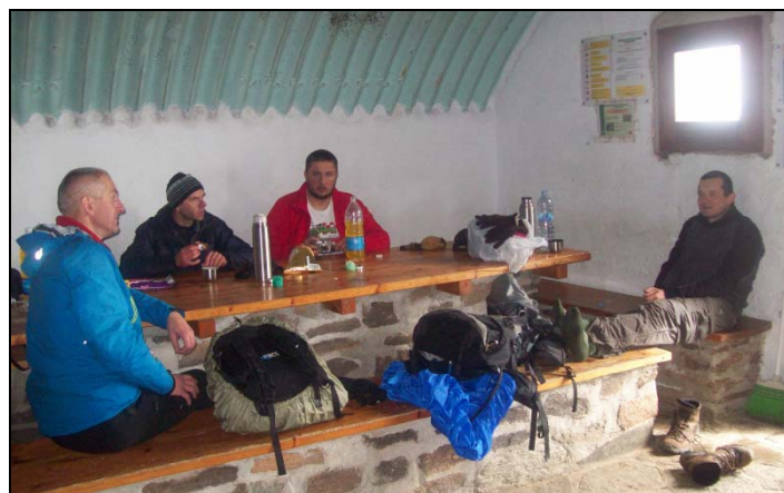
odpoczynek w refugio po zejściu z Mulhacena

Po Polski wróciliśmy w sobotę rano lecąc z lotniska Barcelona-Girona bezpośrednio do podkrakowskich Balic kończąc w ten sposób tygodniową przygodę z Hiszpanią.