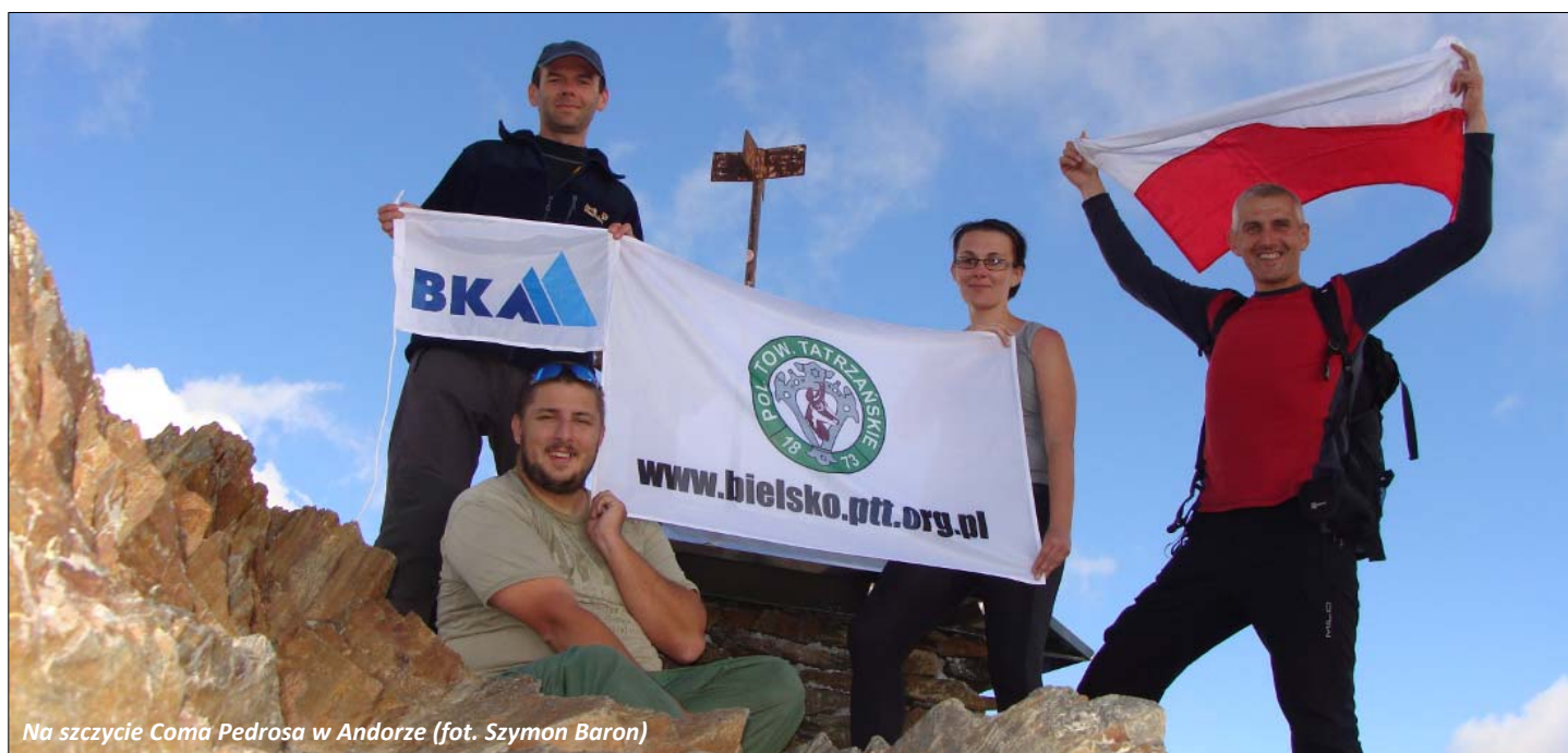
Na szczycie Coma Pedrosa w Andorze