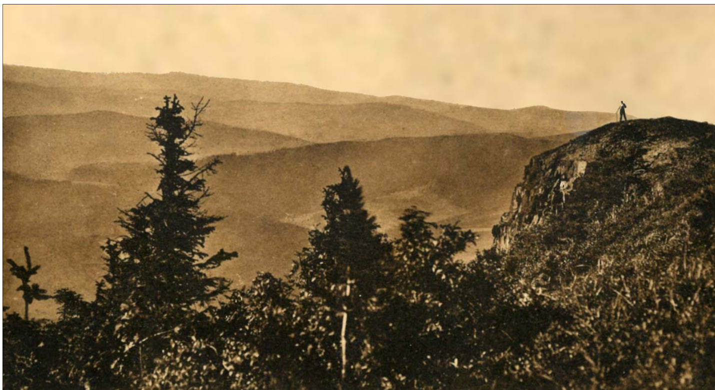
Sokolica pod Babią Górą – fragment pocztówki z 1928 r. wydanej przez Koło PTT w Białej

z tatrzańskim pozdrowieniem, Zarząd Oddziału