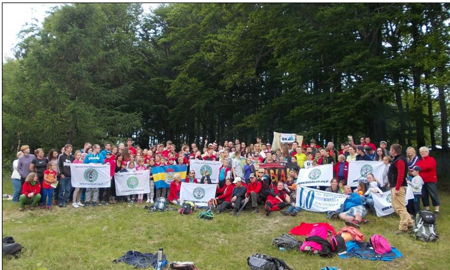
uczestnicy finałowego sprzątania na polanie pod szczytem Hrobaczej Łąki

Oby i tym razem turyści uszanowali nasz wkład w sprzątanie szlaków Beskidu i pozostawiali po sobie porządek. Podsumowując, w niedzielę 14 czerwca 2015 roku w sprzątaniu szlaku udział wzięło ośmiu członków naszego Koła i zebraliśmy około 60 litrów śmieci.