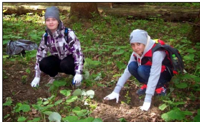
młodzież z Rybarzowic sadzi las pod Babią Górą, 16.05.2015