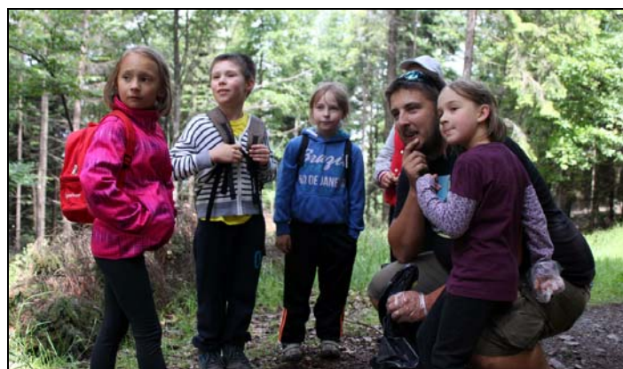
prezes oddziału z grupką dzieci w drodze na Hrobczą Łąkę, 20.06.2015