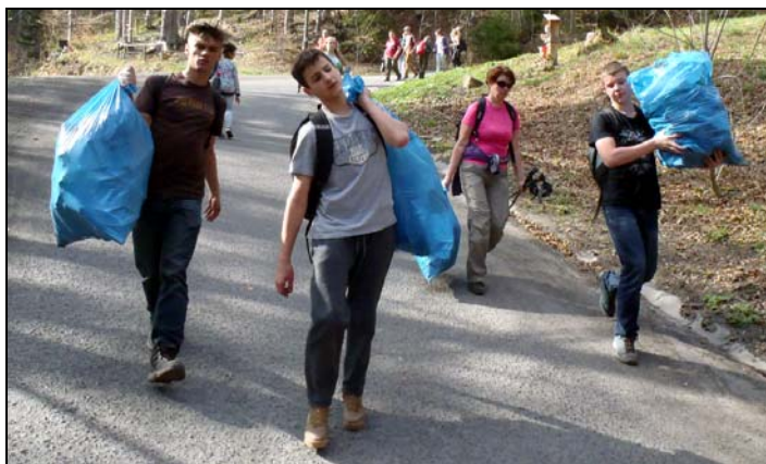
młodzież z Chrzanowa podczas zejścia z Klimczoka, 25.04.2015