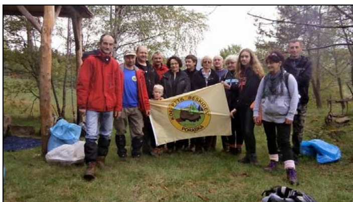
uczestnicy sprzątania w rejonie Bukowskiego Gronia, 10.05.2015