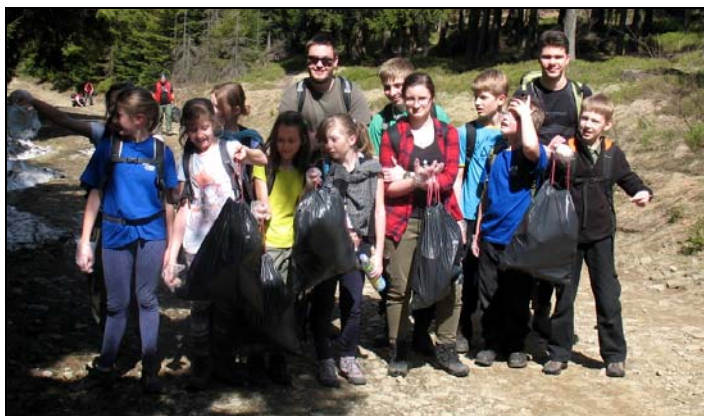
harcerze z ZHP w drodze na Szyndzielnię, 25.04.2015