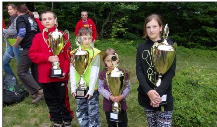
puchary dla najaktywniejszych grup przygotowane do wręczenia, 20.06.2015