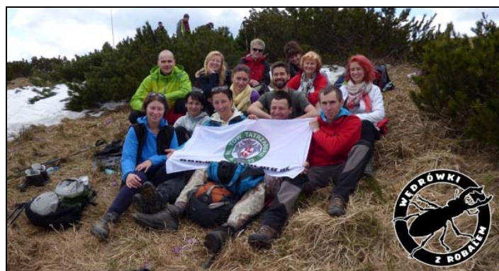
Fot. Grzegorz Gierlasiński

Na kolejną wycieczkę z cyklu „Wycieczki z Robalem” wybrała się trzynastoosobowa grupa członków i sympatyków naszego oddziału, za cel obierając szczyty Wielkiej Fatry – Ostredok i Krizną. Podczas dwudniowej wycieczki zdobyto także inne szczyty tego pasma gór - Ploskę, Cierny, Kamen i Borisov.