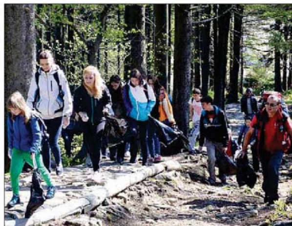
Na sprzątanie babiogórskich szlaków wyruszyli w sobotę miłośnicy górskich wędrowek.