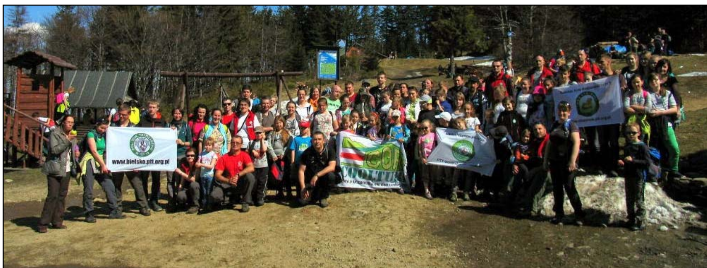
uczestnicy akcji „Sprzątamy Beskidy z PTT 2015” w rejonie Szyndzielni i Klimczoka

z tatrzańskim pozdrowieniem, Zarząd Oddziału