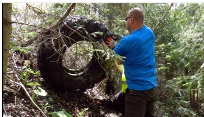
grupa dorosłych sprząta okolice drogi na Krowiarki, 16.05.2015