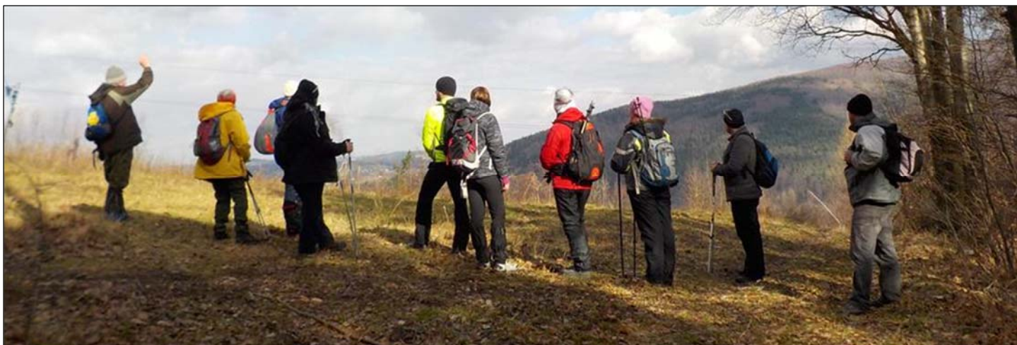
podczas letowej wycieczki na Bliźniaki w Beskidzie Małym

z tatrzańskim pozdrowieniem, Zarząd Oddziału